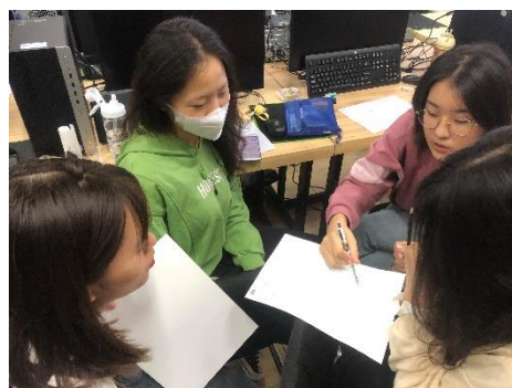
学生课堂方案讨论

课程过程中，在原有专业知识讲解的基础上，增加了方案设计前期分析以及版式设计的比重，鼓励学生认真完成作业并积极投稿，取得了银奖 4 项、铜奖 3 项、优秀奖 1 项的成绩，教学方式方法改革取得一定效果。